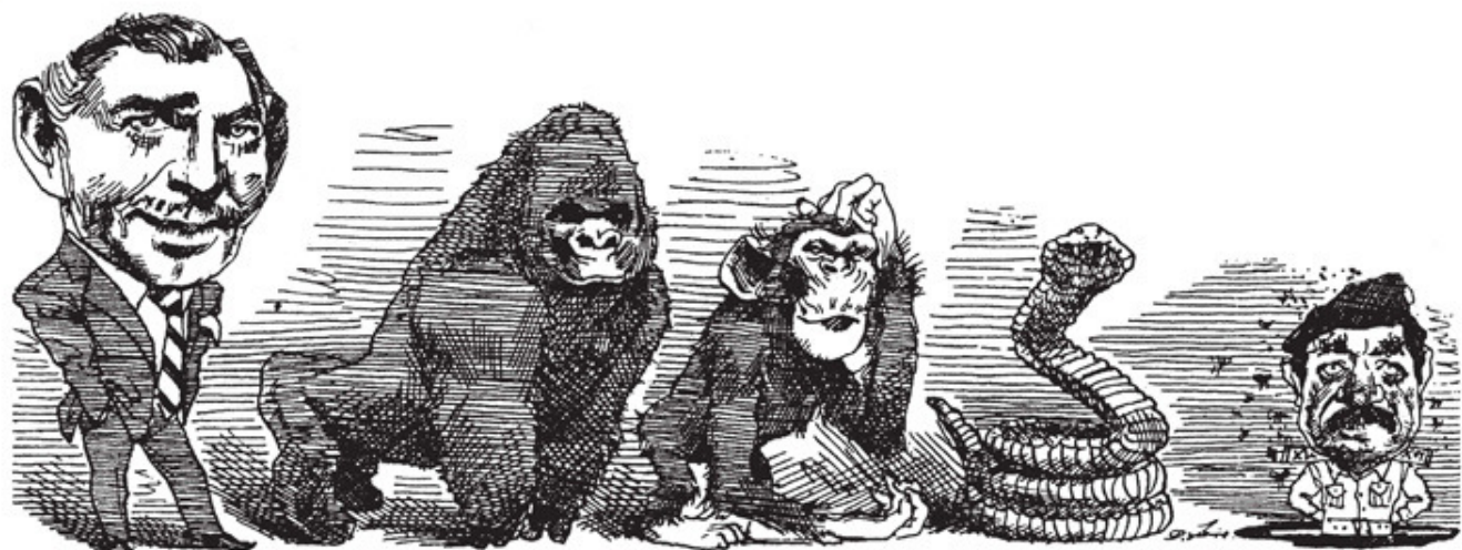
BLEV TRYKT. Tegningen af 'Menneskets afstamning' med Saddam Hussein som det absolutte udgangspunkt var lidt for darwinistisk efter mange læsers mening. De klagede til avisen. (Illustration: David Levine (fra bogen))