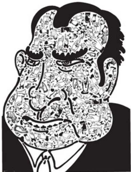
BLEV TRYKT. Richard Nixon var, som tegneren Seymour Chwast udtrykte det, en karikaturtegners drøm. Her konstaterer han, at 'valle fingre peger på den skyldige'.