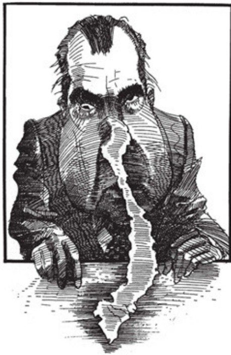
BLEV TRYKT. Richard Nixons kraftige kæber og markante hårgrense gjorde ham let at karikere - sammen med hans store næse. Her er den noget længere end sædvanligt, formet som Vietnam.