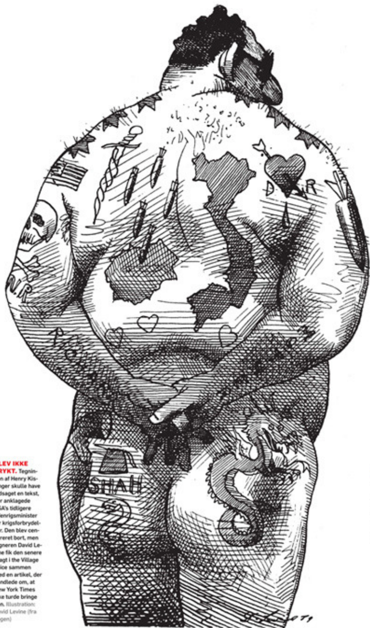
BLEV IKKE TRYKT. Tegningen af Henry Kissinger skulle have ledsaget en tekst, der anklagede USA's tidligere udenrigsminister for krigsforbrydelser. Den blev censureret bort, men tegneren David Levine fik den senere bragt i Village Voice sammen med en artikel, der handlede om, at New York Times ikke turde bringe den.